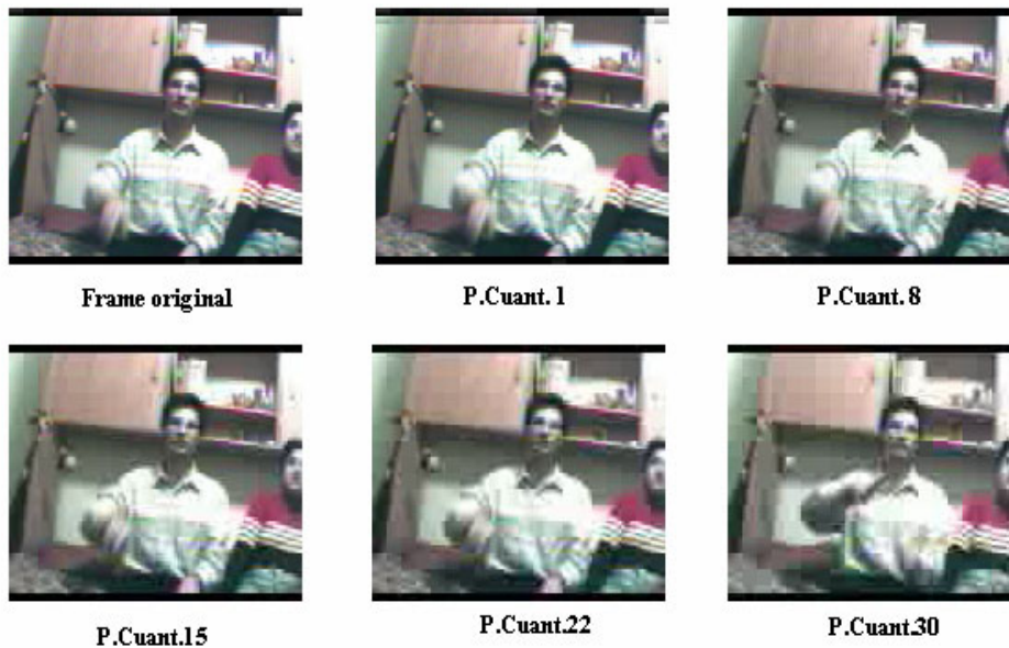
Figura 2: Cuadros obtenidos con distintos parámetros de cuantización

Una segunda experiencia práctica se realiza con el tamaño de los bloques con los que se opera al calcular la DCT, de manera que el alumno, a parte de rellenar una tabla similar a la anterior, debe observar como, con bloques más pequeños, el cálculo de la DCT pasa de ser una de las fases más costosas a tener unos costes computacionales mucho más equilibrados.